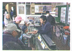
▲亀山市の科学の祭典で毎年展示を行っている