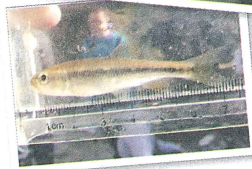
▲捕まえた魚は専用の道具で大きさを確認する