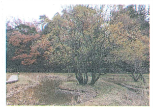
▲子供の頃から遊んでいた通学路脇に整備された亀山里山公園