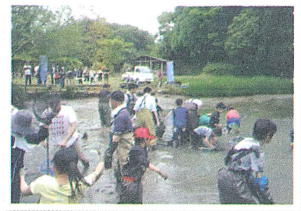
▲水質の改善や調査等を目的に行う池干し