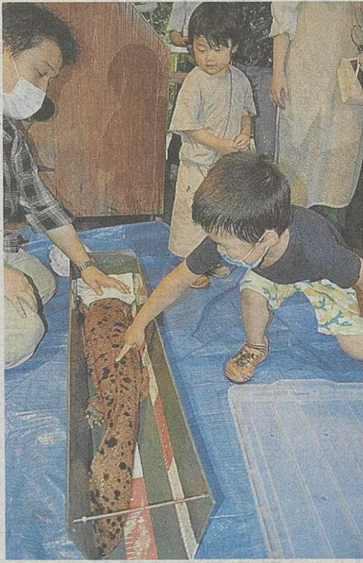
引越してきたオオサンショウウオに触れる子ども＝名張市赤目町長坂