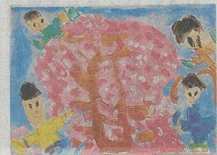
市長賞「さくらとおにごっこ」