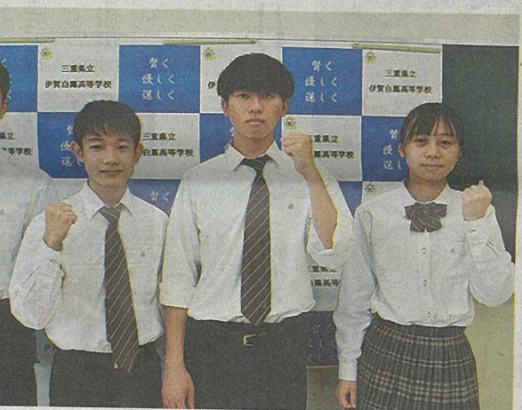
高校総体に出場する陸上競技部、卓球弓道部の主将たち-伊賀市緑ヶ丘西町で

ふじや 心をつなぐ 家族葬 事前相談 受付中 四日市光輪会館(桜・富田) 0120-114248 津光輪会館 0120-248317